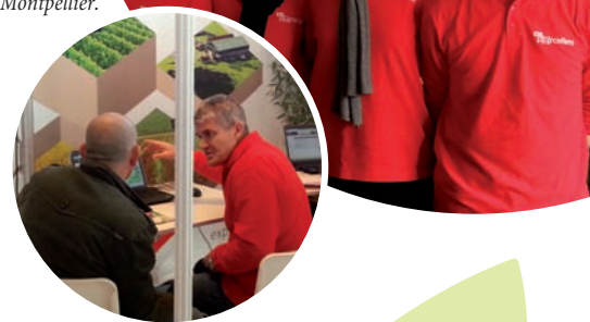
Une partie de l'équipe «Mes Parcelles» lors du dernier SITEVI à Montpellier.