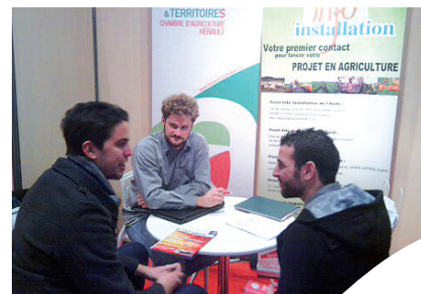
La Chambre d'agriculture au 14 ème forum de la création d'entreprise, au Corum de Montpellier.

Le stand s'est révélé être aussi un lieu d'information pour les créateurs de restauration ou de transformation à la recherche de producteurs chez qui se fournir et avec lesquels mettre en place des circuits de commercialisation courts et locaux. Un besoin récurrent parmi le public de ces salons de création, qui confirme l'intérêt pour la Chambre d'agriculture de l'Hérault d'y être présente pour y exposer ses services.