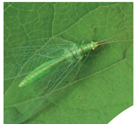
Chrysope - Crédit photo © Entomart

Contacts à la Chambre d'agriculture de l'Hérault Service Territoires - 04 67 20 88 55 Service Viticulture - 04 67 20 88 32