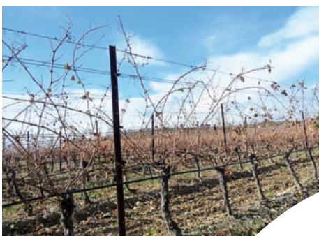
Vignes de la Jasse - novembre 2013.

Vendredi 25 novembre : l'équipe du domaine de la JASSE et de la Chambre d'agriculture de l'Hérault ont voulu marquer par un événementiel la certification H.V.E. de cette exploitation viticole. Dans l'Hérault, c'est la première exploitation à obtenir cette certification.