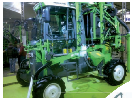
Le tracteur enjambeur électrique Voltis de Tecnomat a obtenu la médaille d'Argent.

Débits : de 1 100 à 1 700 kg/heure en abricot jusqu'à 2 tonnes/heure en pêche, selon le nombre de sorties.