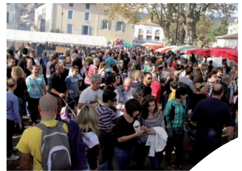
Place du Foinlet à Saint Pons de Thomières : Marché Bienvenue à la Ferme pendant la Fête de la Châtaigne.

«Quelle est la différence entre une châtaigne et un marron ?» «Où en est la démarche d'AOP Châtaigne des Cévennes ?» «Bienvenue à la Ferme, quésaco ?» Autant de questions pour lesquelles le grand public a pu trouver des réponses sur le stand de la Chambre d'agri-