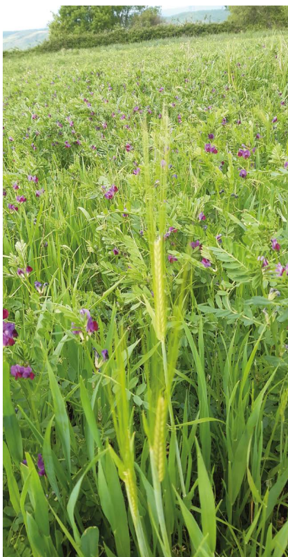
Le sorgho fourragère reste productif en été

Réalisé sous l'égide du GIE Elevage Occitanie, en partenariat avec 6 Chambres d'agriculture d'Occitanie (Aveyron, Gers, Hérault, Lot, Lozère, et Tarn) et l'Institut de l'élevage, le projet « GO PEI : vers des systèmes de production caprins durables en Occitanie » est désormais terminé. Se déroulant du 1er mars 2019 au 30 juin 2023, ce projet a réalisé son objectif d'accompagner la transformation des systèmes de production caprins de la région vers une plus grande durabilité et de créer une dynamique R&D caprine à l'échelle régionale par la mise en réseau de groupes d'éleveurs motivés et d'un réseau pluridisciplinaire de chercheurs et de conseillers.