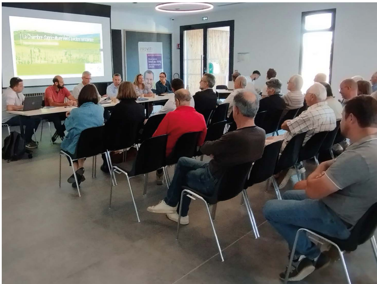
GAT_Biterrois Est à Sérignan