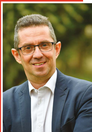
Jérôme Despey Président de la Chambre d'agriculture de l'Hérault