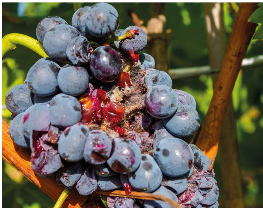
Le repérage des œufs de Cryptoblabes est pratiquement impossible car les femelles pondent à l'intérieur des grappes, sur la rafle et les pédicelles, et non à la surface des baies comme le ferait Eudémis. Les larves se développent ainsi dans la plus grande discrétion et ne deviennent visibles qu'à un stade de destruction avancé. Les trichogrammes présentent l'avantage d'accéder facilement au cœur des grappes, contrairement aux traitements insecticides classiques.

Paul Hublart 06 19 63 12 58 paul.hublart@herault.chambagri.fr