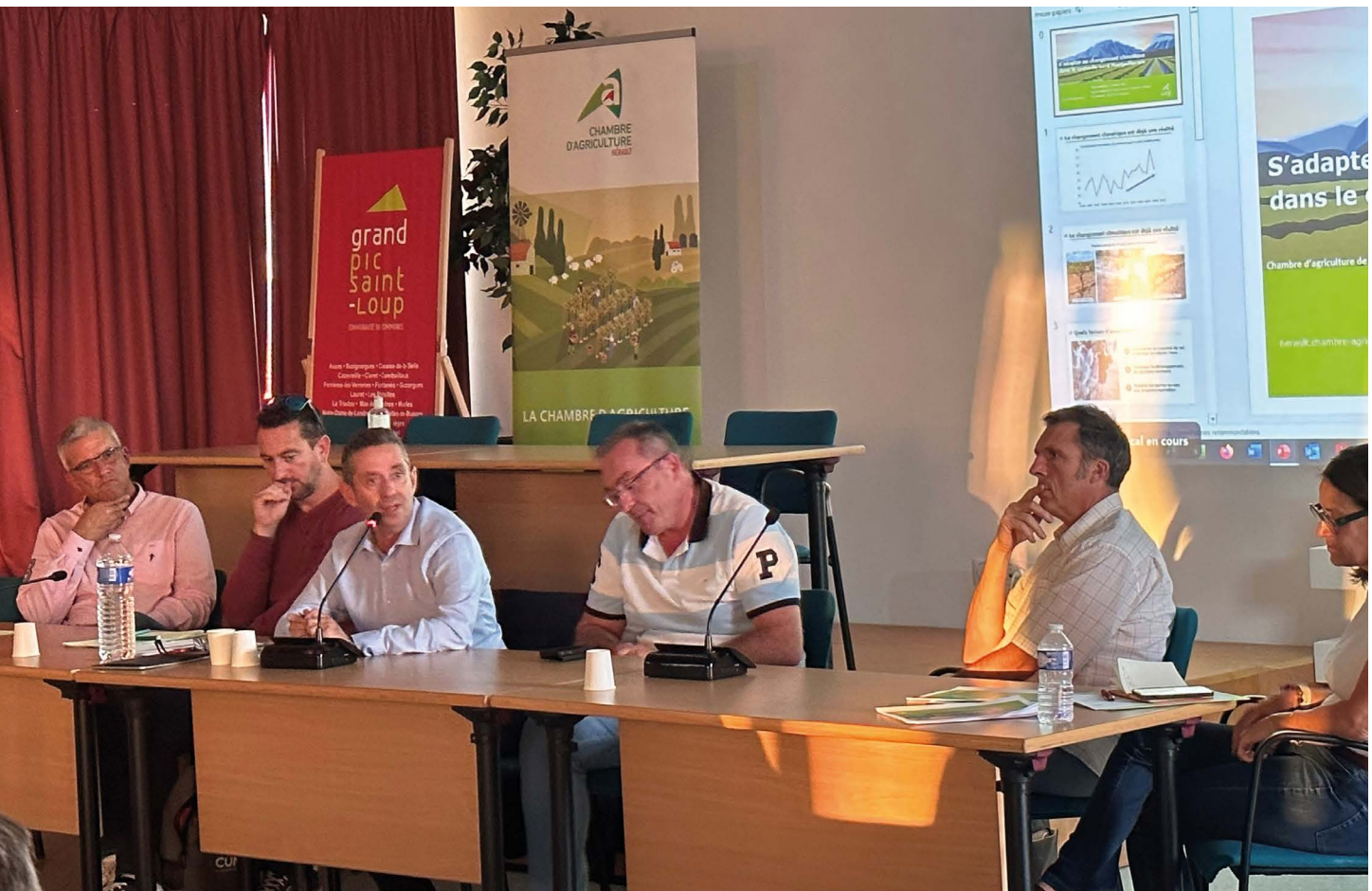
GAT_Pic Saint Loup © Florian Mégou.