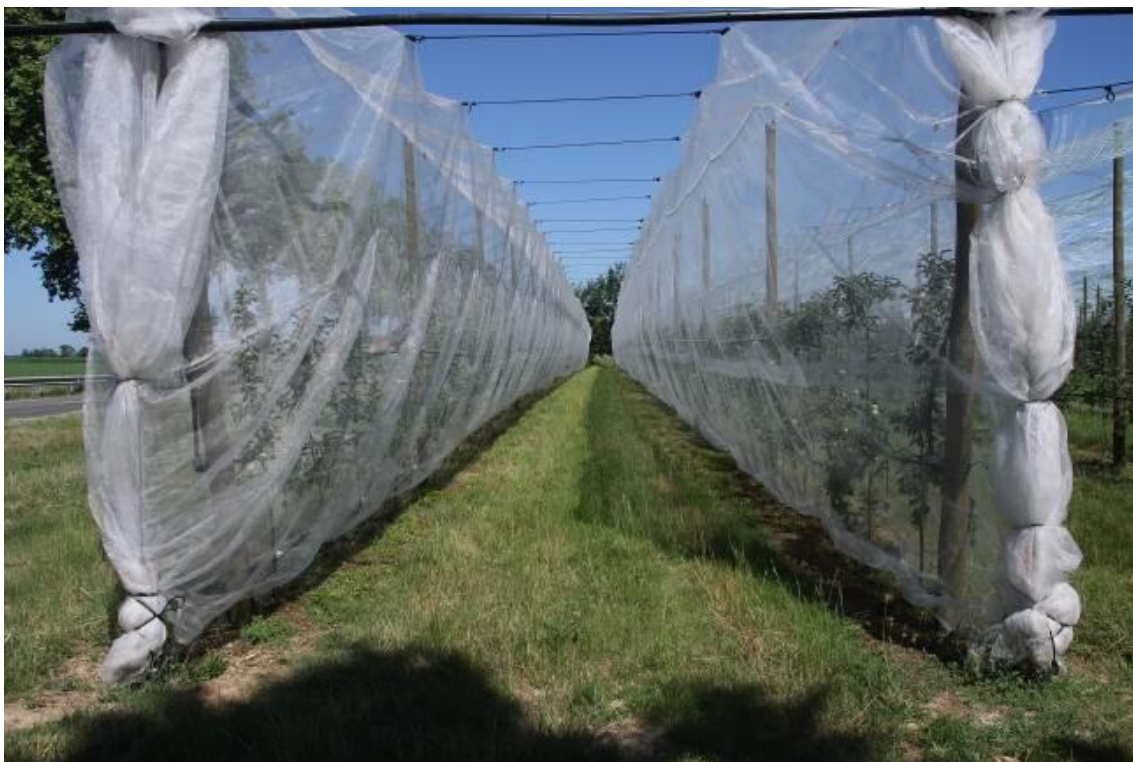
Système Alt'Carpo monorang (CEFEL)

La fermeture du système Alt'Carpo monorang a été réalisée après la floraison du pommier.