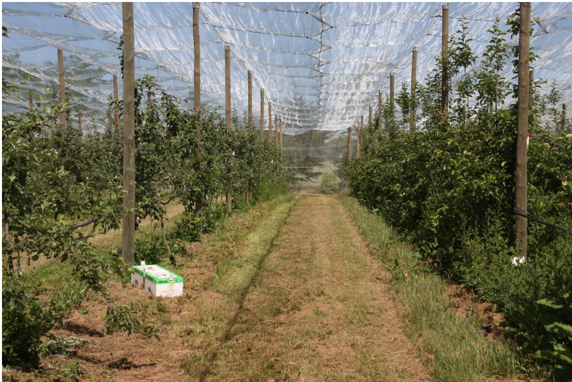
Système Alt'Carpo mono-parcelle (CEFEL) avec une ruche à bourdon