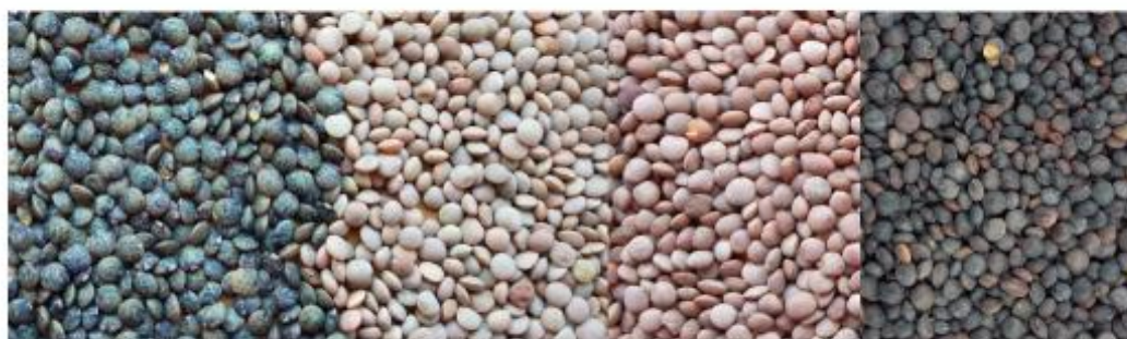
Verte (Anicia) AgriObtentions 1966 Blonde (Flora) AgriObtentions 2002 Corail (Rosana) AgriObtentions 2003 Noire (Belouga) Lentille fourragère AOC (lentille verte du Puy) IGP et Label Rouge (lentille verte du Berry) Lentille blonde de St Flour

Cette culture des régions tempérées accepte les sols frais, mais craint la concurrence des adventives. Au moins quatre couleurs de graines se rencontrent dans les contrats, mais la verte reste la plus produite : la blonde ne peut se faire qu'en pur, elle reste la lentille la plus importée.